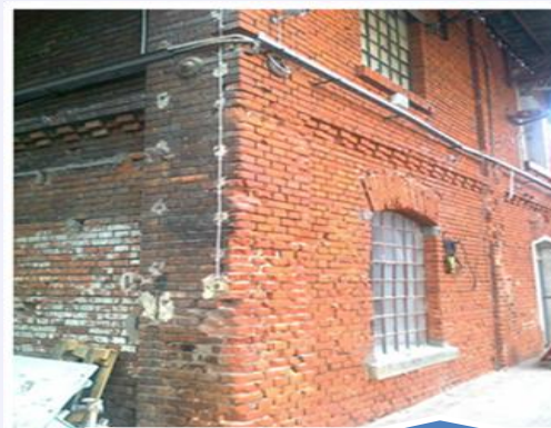
Konserwacja murów ceglanych