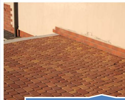
Poprawianie wyglądu powierzchni