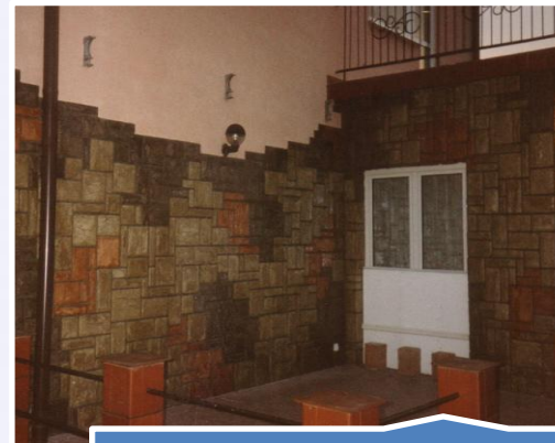
Zabezpieczanie okładzin kamiennych