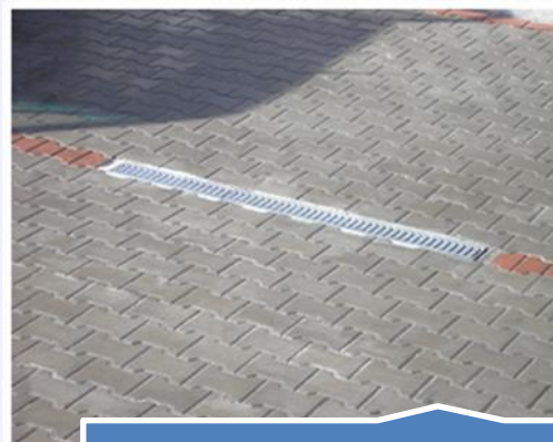
Impregnacja kostki brukowej